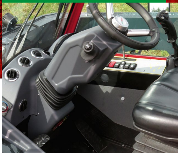
Lavt støjniveau og masser af plads

Takket være den støjdæmpende kabine kan du arbejde i Tool-Trac 5740 uden behov for høreværn, og med den ekstra benplads og AC som standard er du sikker på en behagelig arbejdsoplevelse – hele dagen.