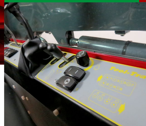
Fuld kontrol lige ved hånden

Kontrolpanelet i Tool-Trac 5740 er blevet forbedret. Det giver dig fuld kontrol og en naturlig armstilling under betjening, og minimerer risikoen for ømhed og skader.