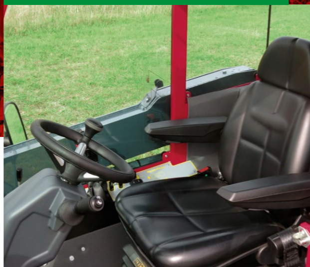
Luftaffjedret ergonomisk førersæde

Det luftaffjedrede og ergonomisk justerbare førersæde sikrer dig mod smerter i lænd og ryg. Sædet er placeret lavt og i lige stor afstand mellem for- og bagaksel, hvilket giver dig en stabil kørsel selv i ujævnt terræn.