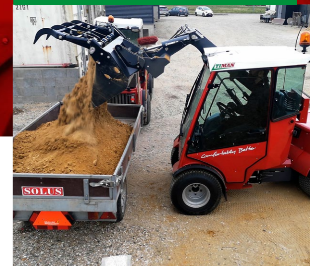
Frit udsyn til arbejdet

Løftearmen på Tool-Trac 5740 er placeret på kabinens højre side. Det betyder, at du til hver en tid har frit udsyn til arbejdet, modsat andre maskiner på markedet, som har løftetårn monteret foran.