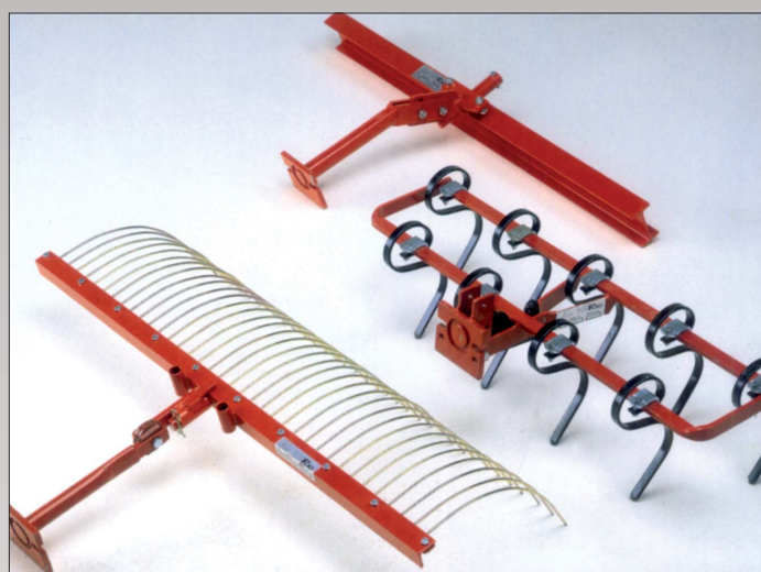
Rive 120 cm med dobbelttænder, incl. træktoj. Planérskinne, I-formet bredde 120 cm, incl. træktoj. Kultivator/Harve leveres med 9 tænder, som kan justeres, så bredden kan variere fra 55 - 95 cm.