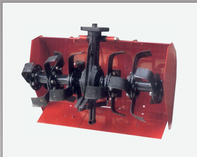
Nibbi-fræsere er konstrueret til hårdt og vedvarende arbejde hver dag. De kan alle justeres i bredden og knivene er fremstillet af kraftigt fjederstål med livslang garanti mod brud. Når bakgearet benyttes, frakobles knivene på fræseren automatisk.