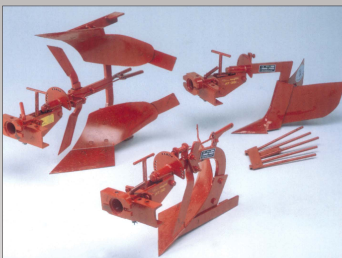
Plov, 8" enkelt eller vendeplov med universalophæng der muliggør side- og skråindstilling. Hyppeplov komplet med kartoffeloptager kan kobles direkte på ophængen.