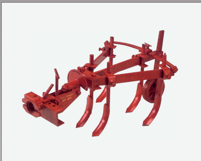
Kultivator er indstillelig og med 5 tænder.