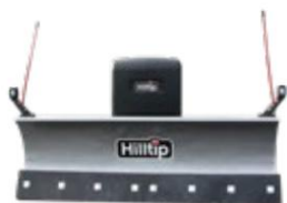
Lige blad (SUTV)

Det buede, pulverlakerede blad er lavet af højstyrkestål, hvilket i dette tilfælde er nøglen til vores holdbare, men lette plov. To segmenterede skær med udløserfjedre beskytter ploven og køretøjet mod stød, når man rammer forhindringer. Skæret fås i polyurethan eller stål.