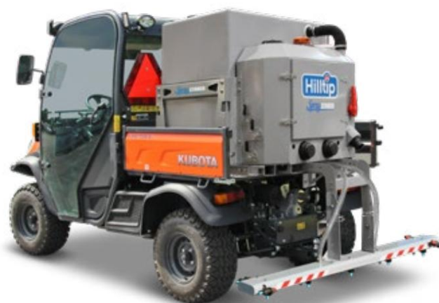
SprayStriker™ 500 på Kubota erhvervskretøj

Væskepumperne og CPU-enheden er beskyttet i et lettilgængeligt kabinet af rustfrit stål. Disse fuldt 12V elektrisk drevne enheder hjælper entreprenører med at reducere saltforbruget og samtidig øge deres serviceniveau.