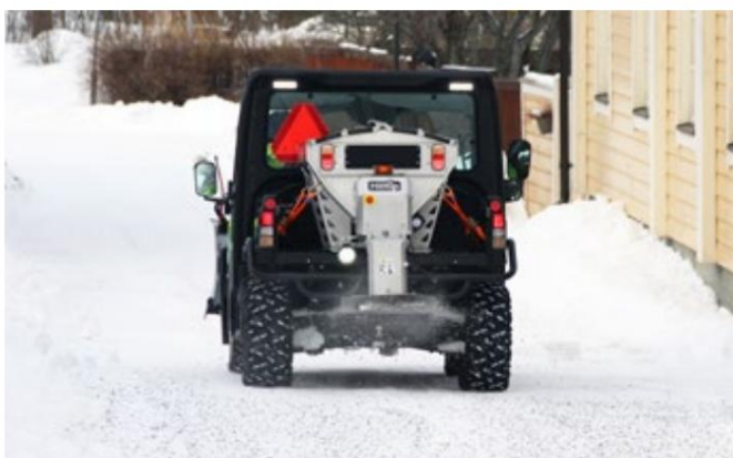
Spreddebredde op til 8 meter