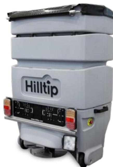
IceStriker™ 300 bagklapsspreder

"Smartphone-styret spreder til installation på UTV"