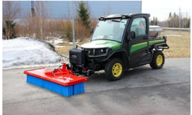
SweepAway™ 150-300 HSM skubbekost

Fejehovedet består af separate, udskiftelige Børsterækker lavet af polypropylen . Sektionerne er nemme at udskifte og hjælper dig med at holde din fejmaskine i topform. SweepAway™ -skubbekosten er vedligeholdelsesfri og nem at rengøre, da den ikke har højteknologiske eller roterende dele!