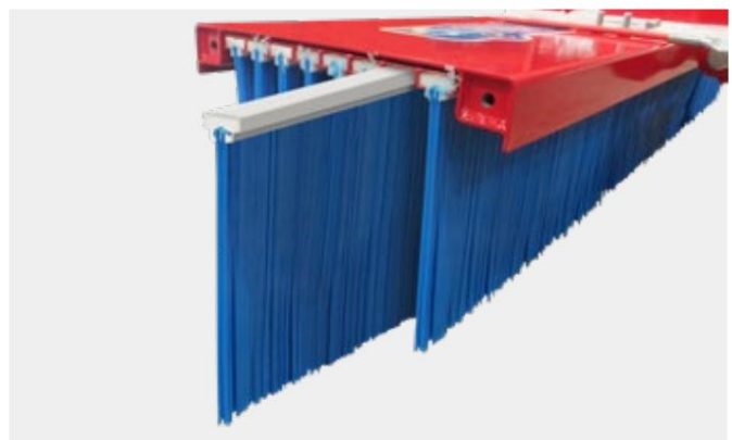
Udskiftning af børsterækkerne er hurtigt og nemt