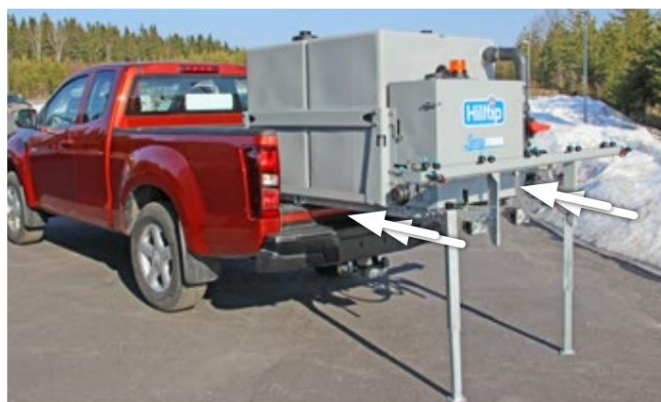
Valgfrit benstativ og glideskinner på ladet for nem montering og afmontering af sprøjten.