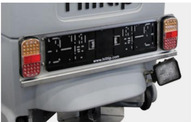
LED-baglygter, nummerpladesæt og LED-arbejdslygte