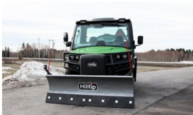
SnowStriker™ SUTV med polyurethan-skærkant