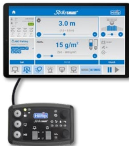
8,7" berøringsskærm og kontrolpanel

Hilltips HTrack™ sporings- og kontrolsystem er hjertet i vores innovative system i vores spredere og sprøjter, der er designet til at give dig information og kontrol over din spredersflåde i realtid.