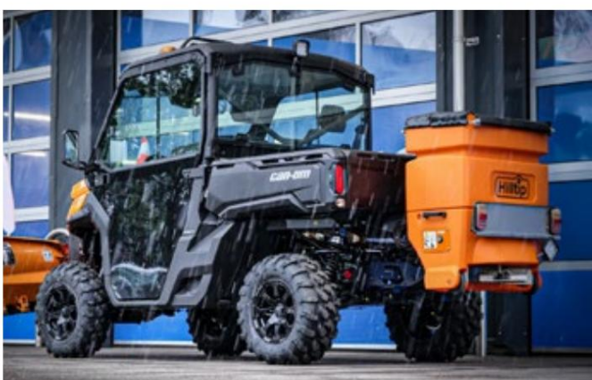
Valgfri farve: orange