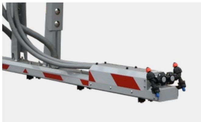
Dobbelte sprøjtedyser til afisning selv ved højere hastigheder