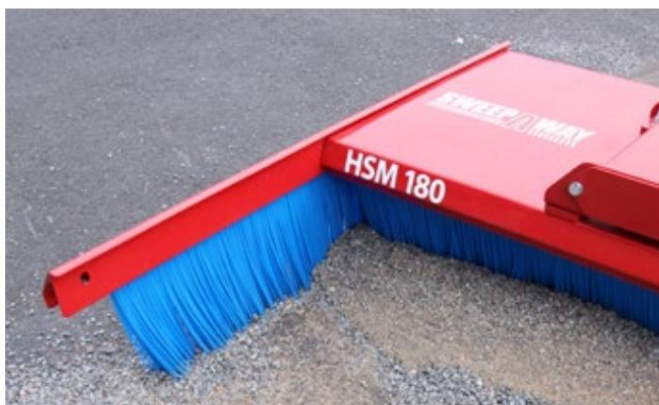
SweepAway™ HSM med sidebørste