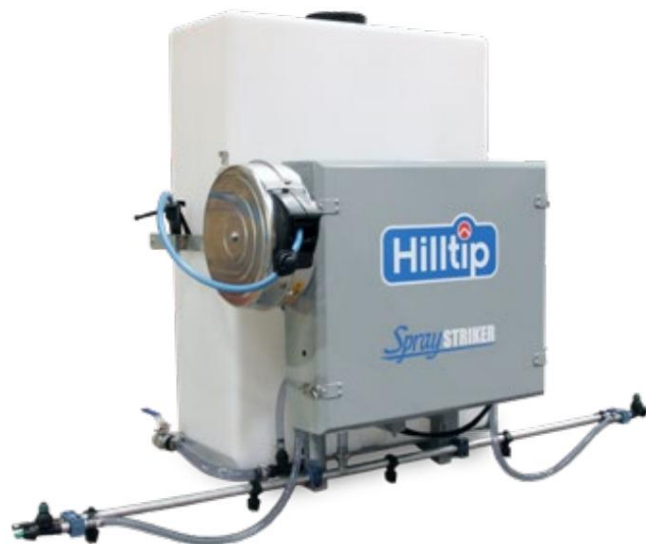
SprayStriker™ 250 L

Sprøjteenheden kan også udstyres med desinfektionsdysere på både håndholdte og spray bardysere til at bekæmpe bakterier, bakterier og vira.