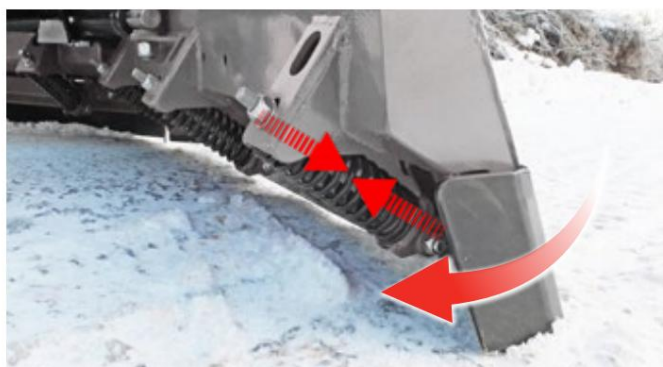
Skærende kant med udløserfjedre