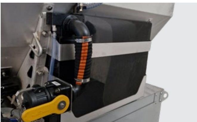
IceStriker™ 380 med forvandlingstank