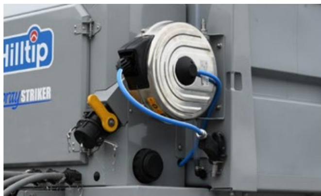
Manuel slangeopruller (ekstraudstyr), 12 m