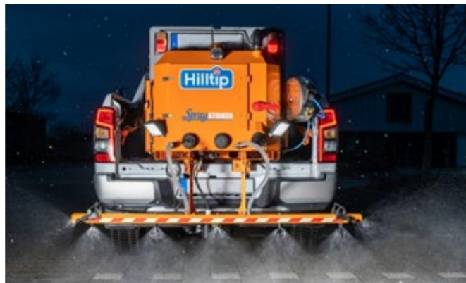
IceStriker™ 500 i valgfri orange farve