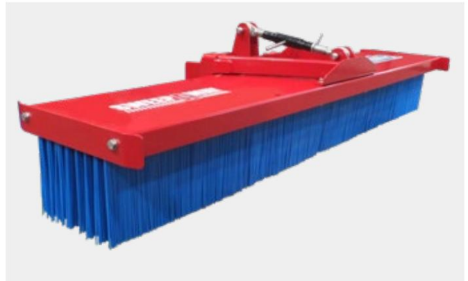
SweepAway™ 150-200 HSL skubbekost